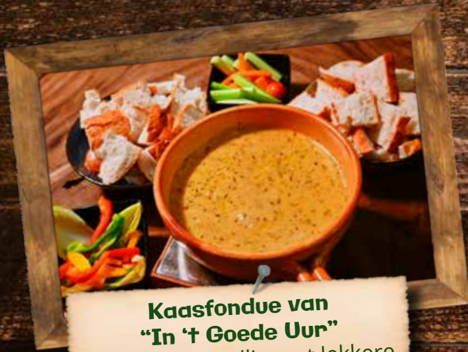
Kaasfondue van "In 't Goede Uur"

TIP: Begin gezellig met lekkere (lokale) damhertenworst