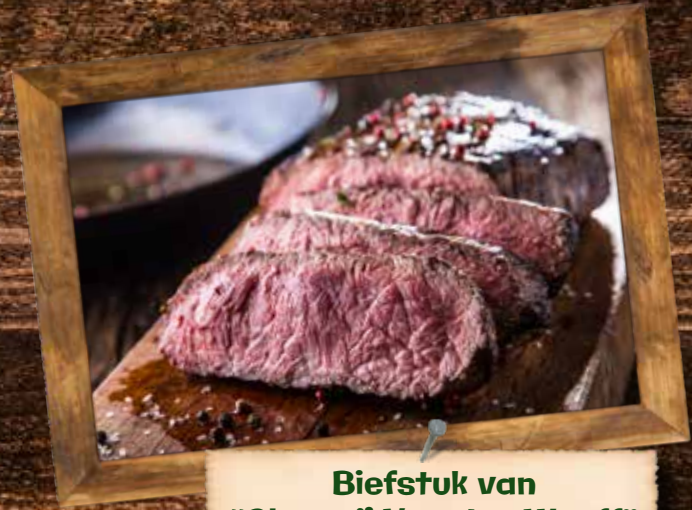
Biefstuk van "Slagerij Van der Werff"

TIP: Begin gezellig met lekkere (lokale) damhertenworst